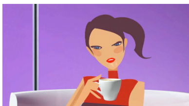
Pub TV et programme TF1 conso