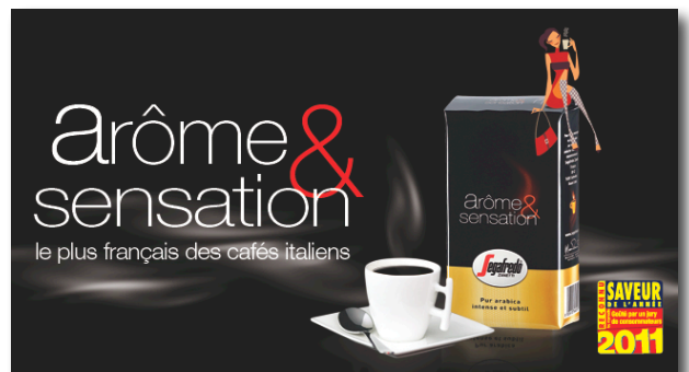
PLV et leaflet